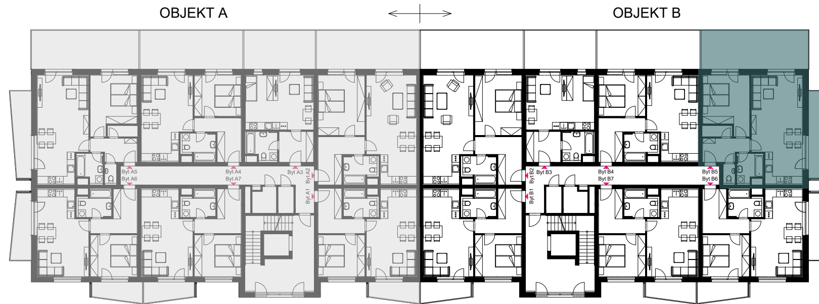
Schéma umístění bytu v objektu - 2.NP