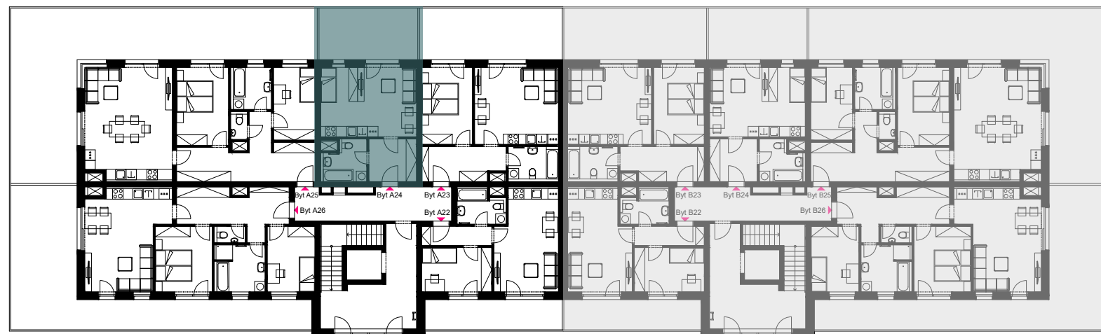
Schéma umístění bytu v objektu - 5.NP